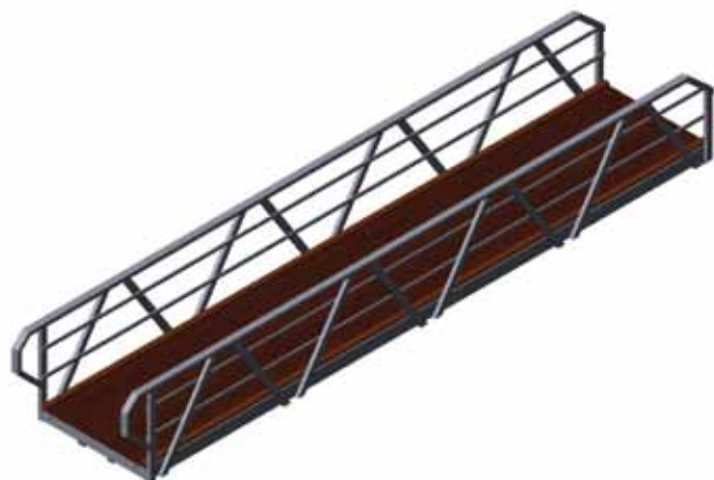
Ponte de alumínio 8 x 1,5m